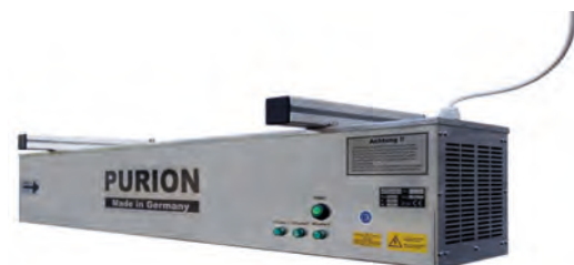
article number: 160 03700 0000