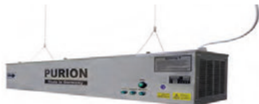
article number: 160 03600 0000